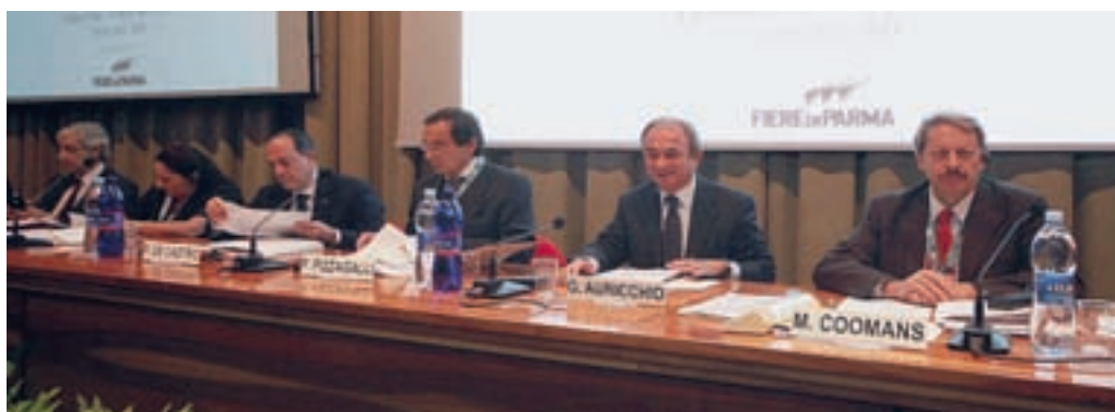
Meat day In alto un impianto «in vetrina», qui sopra il convegno organizzato dall'Assica.